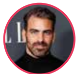
Nyle Di Marco